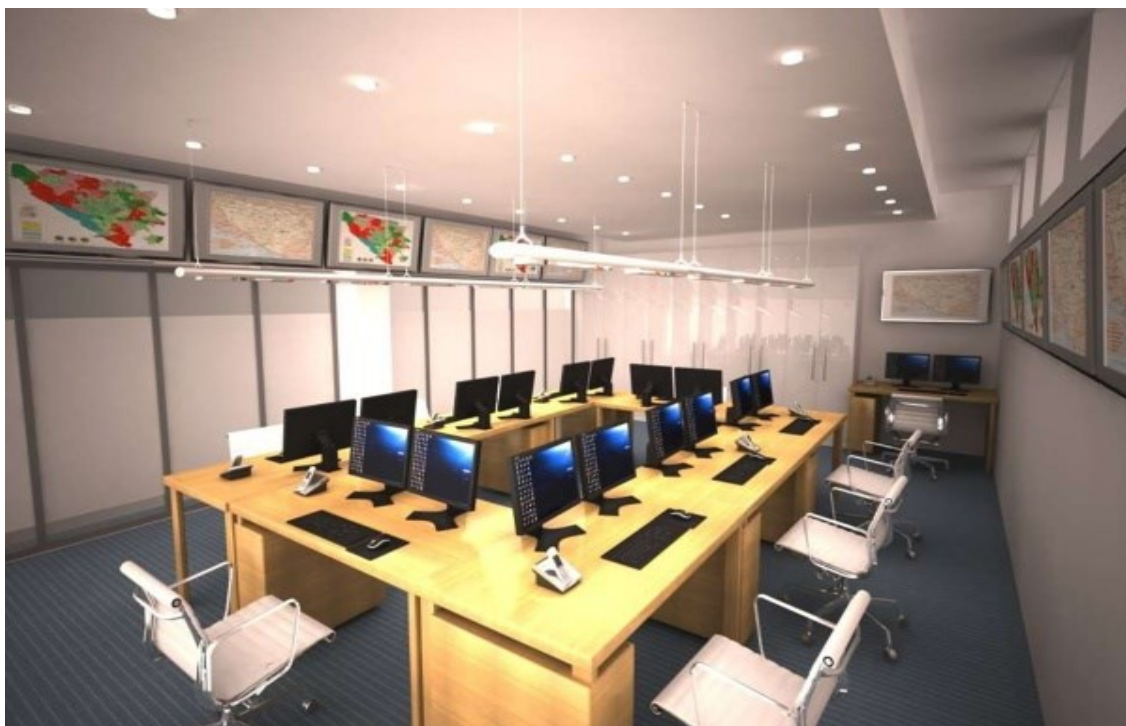
Slika 6. Operativno-komunikacijski centar BiH – 112 , (Agić, 2009)