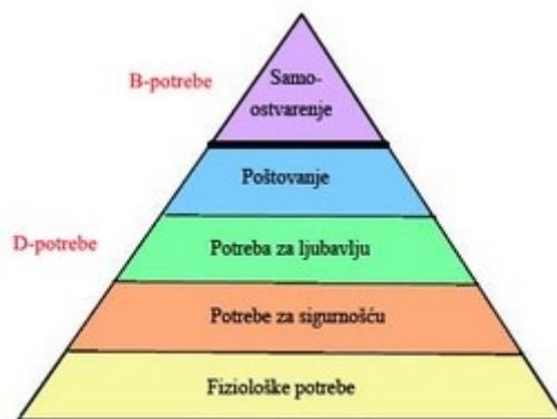
Slika 2: Piramida potreba prema Abraham-u Maslow-u

Jedna od osnovnih ljudskih potreba jeste potreba za sigurnošću. U drugoj polovini 20. vijeka, američki psiholog Abraham H. Maslow napravio je hijerarhiju potreba (slika 2) u koju je potrebu za sigurnošću svrstao na drugo mjesto, nakon osnovnih fizioloških potreba (blogspot.com, 2016). Upravo kako bi zadovoljili tu svoju potrebu za sigurnošću ljudi poduzimaju različite mjere zaštite.