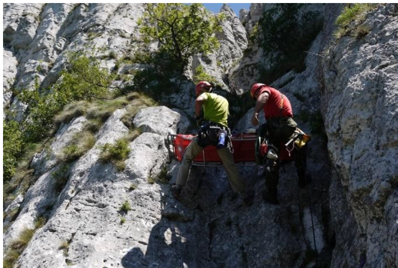
Slika 21. Spašavanje iz stijene – GSS Republike Srbije,(Gorska služba spašavanja Republike Srbije -GSS, 2019)

oprema za orijentaciju, itd. Opremu ove vrste karakteriše visoka cijena nabavke, ali i ograničeno vreme korištenja(Gorska služba spašavanja Republike Srbije -GSS, 2019).