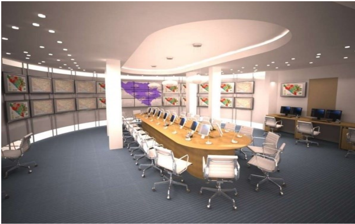
Slika 7. Centar Koordinacionog tijela za zaštitu i spašavanje BiH, (Agić, 2009)

Granična policija BiH ostvarila je dobre rezultate u smislu rješavanja pitanja prelaska granice, a u vezi problematike pružanja pomoći. Agencija za istrage i zaštitu BiH (SIPA) nema mandat i nije učestvovala u aktivnostima Civilne zaštite. S druge strane entitetske policijske snage su učestvovala u akcijama zaštite i spašavanja u skladu sa mandatom i često se unutar ove strukture provode aktivnosti na obučavanju i usavršavanju za date situacije (Agić, 2009).