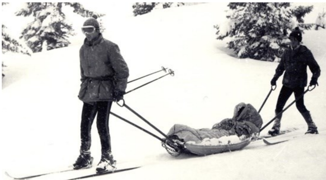
Slika 13: Alpinistička sekcija Planinarsko-smučarskog društva Javorak(GSS Republike Crne Gore, 2019)

saobraćajnim nesrećama u kanjonima, izvlačenju unesrećenih iz jama, u avionskim, helikopterskim i željezničkim nesrećama, transportima bolesnika iz snijegom zavijanih područja i u ostalim akcijama spašavanja ljudskih života u planinskim i ostalim nepristupačnim mjestima u Crnoj Gori(GSS Republike Crne Gore, 2019).