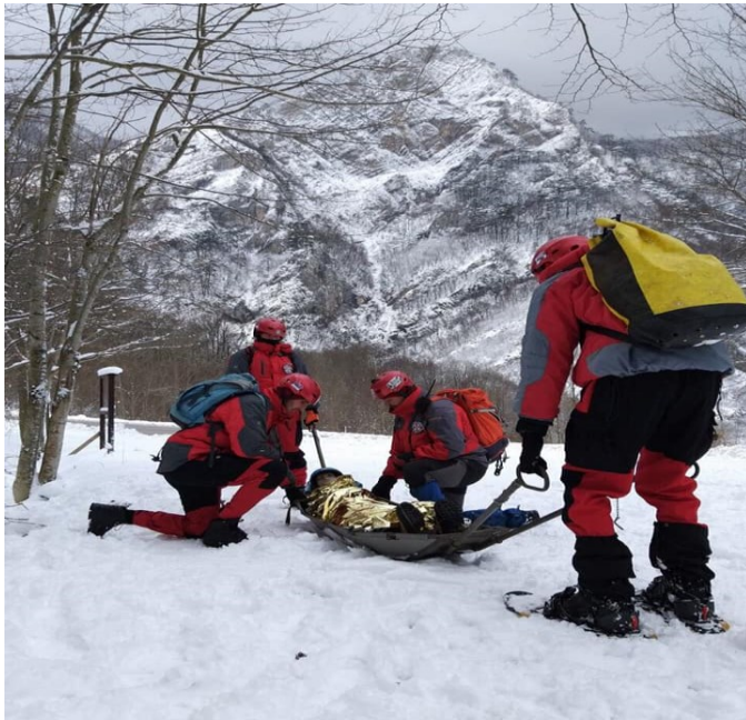
Slika 20. Spašavanje u zimskim planinskim uslovima–GSS Foča

Za izvođenje spašavanja na nepristupačnim terenima neophodna je velika količina raznovrsne, kvalitetne opreme: lična oprema spasilaca (spasilačka uniforma), oprema za pružanje prve i hitne medicinske pomoći, oprema za pristup povrijeđenom (oprema za speleologiju, oprema za alpinizam, skijaška oprema...), oprema za evakuaciju (oprema namijenjena isključivo za spašavanje), oprema za komunikaciju,