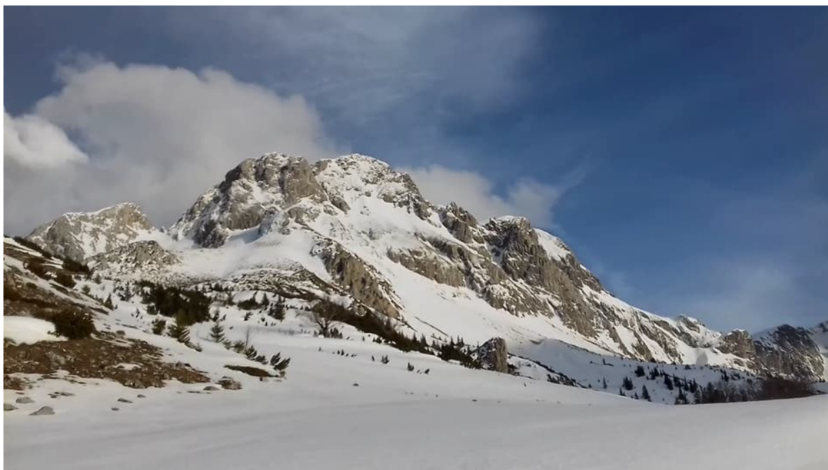
Slika 1. (Planina Maglič, 2386nv/m)

Međunarodna komisija za planinsko spašavanje datira od 1948.godine, kada je pod nazivom "ICAR" osnovana prema švajcarskom zakonu čije sjedište je u Kloten, država Švajcarska. Ona danas predstavlja glavnu svjetsku organizaciju čija je misija da podržava platformu za gorske službe spašavanja čiji je cilj poboljšanje rada gorskih službi spašavanja i njihov siguran rad. Kao krovna organizacija gorskog spašavanja ICAR nije orijentisan prema profitu i nije komercijalizovan, a službeni jezici koji se koriste su engleski, njemački i francuski. ICAR komisija ima 4 komisije koje obuhvataju sve segmente gorskog spašavanja, a to su: