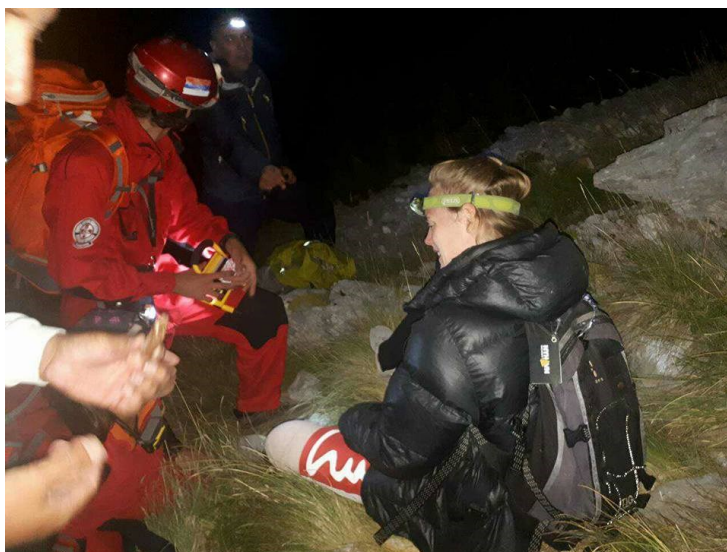
Slika 22. Akcija spašavanja sa planine Maglič, GSS Foča

GSS u BiH je asocijacija koja ima za cilj stvaranje uslova svih spasilačkih kategorija u BiH i time je nezamjenjiv i pouzdan partner svim vladinim institucijama koje se bave zaštitom i spašavanjem. Želja i namjera GSS-a BiH je obučiti i opremiti spasilačke timove koji su 24 sata na terenu 365. dana u godini. (Savez Gorske službe spašavanja u BiH - GSS BiH, 2014).