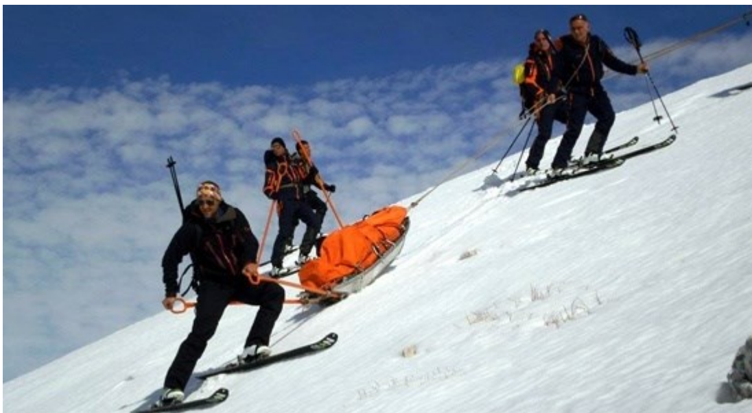
Slika 15. Spašavanje nastratadale osobe u planinskom području, (GSS Republike Crne Gore, 2019)