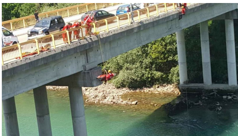
Slika 3. Vježba spašavanja sa visina u Foči, GSS Foča