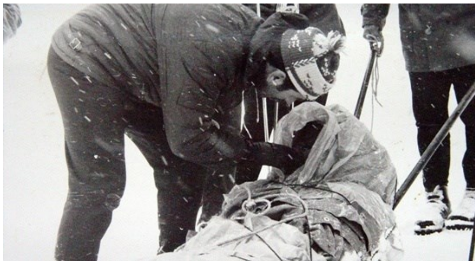
Slika 13. Akcija spašavanja GSS-a crne Gore(GSS Republike Crne Gore, 2019)

GSS CG je član Međunarodne organizacije za alpsko spašavanje - IKAR. To je priznanje za naš dosadašnji rad ali i velika obaveza poštovanja visokih međunarodnih standarda u obuci i spašavanju ljudi u planini (GSS Republike Crne Gore, 2019).