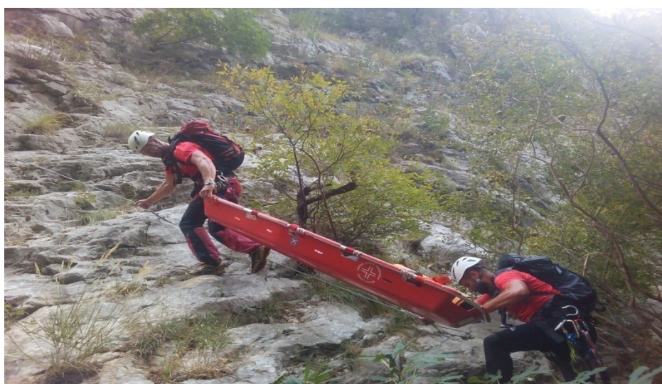
Slika 25. Snimak sa vježbe „Zajedno 2016“ (Gorska služba spašavanja FBiH - GSS FBiH, 2019)

Članstvo u GSS FBiH je dobrovoljno, a Odluku o prijemu nove Stanice u članstvo GSS FBiH donosi Upravni odbor GSS FBiH na osnovu zahtjeva za prijem u članstvo i izjave o prihvaćanju ciljeva i Statuta GSS FBiH. Svojstvo člana GSS FBiH može steći svaka Stanica gorske službe spašavanja registrirana na području FBiH, koja u svojim programskim ciljevima ima srodne aktivnosti potrage i spašavanja. U cilju zajedničkog djelovanja članovi GSS FBiH se mogu povezivati regionalno ili na drugi teritorijalni način u skladu sa svojim opštim aktima i prepoznatim interesima (Gorska služba spašavanja FBiH - GSS FBiH, 2019).