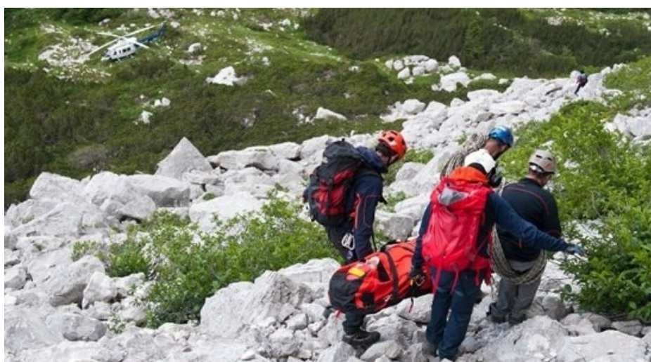
Slika 14. GSS Crna Gora,(GSS Republike Crne Gore, 2019)

Cilj projekta je da kroz obuku i opremanje Obavještajne tačke prerastu u Stanice Gorske službe spašavanja. Prema projektu Gorska služba CG se bavi organizacijom i obukom, Regionalna razvojna agencija za Bjelasicu, Komove i Prokletije i Ministarstvo održivog razvoja i turizma nabavkom opreme, a lokalne uprave Žabljaka i Kolašina obezbjeđenjem prostorija za Obavještajne tačke GSS CG. U koliko se sve bude odvijalo predviđenom dinamikom planirano je da će se 2014. godine steci uslovi za formiranje Stanica GSS na Žabljaku i u Kolašinu(GSS Republike Crne Gore, 2019)(GSS Republike Crne Gore, 2019).