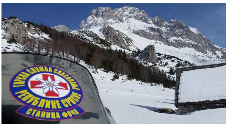
Slika 26. Redovno dežurstvo GSS Foča

GSS Republike Srpske je neprofitna organizacija koja kao takva svoje usluge ne naplaćuje. Finansira se uglavnom iz donacija i dobrovoljnih priloga simpatizera Gorske službe spašavanja.