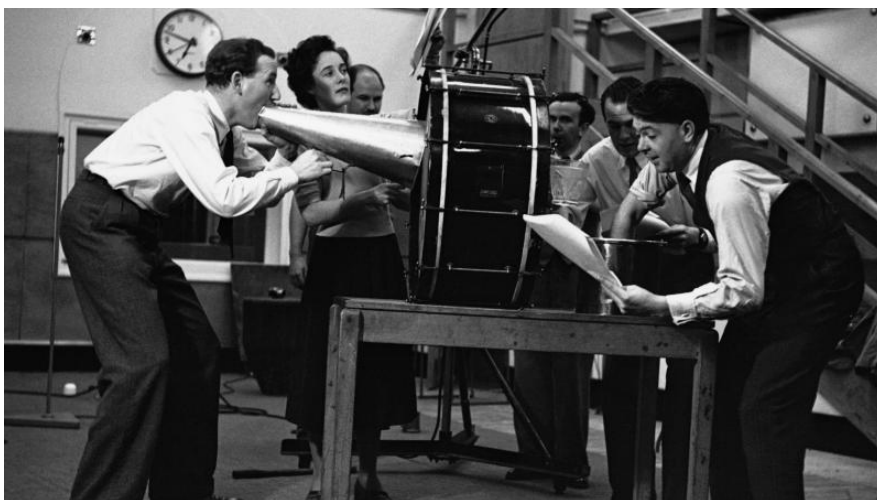
Slika 2. Radio-drama „Rat svjetova“, 30. oktobar 1938.