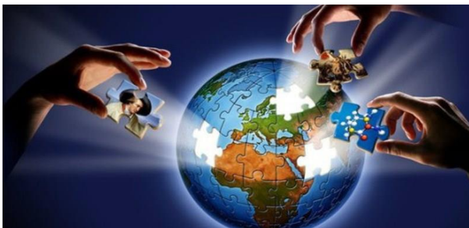
(Slika 5.) Ilustracija globalizacije

Dakle, novi svjetski poredak donio je nekoliko ključnih čimbenika. SAD se postavio kao politički i vojni predvodnik u svjetskim zbivanjima, Internet je donio nove mogućnosti svim gospodarskim granama, snizili su se troškovi poslovanja, informacije su postale lako dostupne, financije su se prometnule u najvažniji element međunarodnoga poslovanja. U tim novim okolnostima, neke države itekako su profitirale i to upravo one koje su imale razrađeni i povezani financijski sustav, poput SAD i Velike Britanije, dok su određene države doživjele odljev kapitala, radne snage i propast industrijskih postrojenja. Važno je napomenuti i kako je nešto više od desetak godina prije sloma Istočnoga bloka napušten zlatni standard po kojemu se dolar mogao konvertirati u zlato. Umjesto toga, dogovoreno je da će se sva trgovina naftom odvijati u dolarima. Uz financijsku umreženost, vojnu neprikosновенost, političke saveznike, dolar kao svjetsku valutu te slom suparničkog bloka, SAD je najbolje iskoristio sve događaje koje su se odvili u zadnjih nekoliko desetljeća 20. stoljeća. Na povjesničarima je da daju svoj sud o tome je li uloga SAD-a u tom razdoblju bila pozitivna ili negativna za svijet.