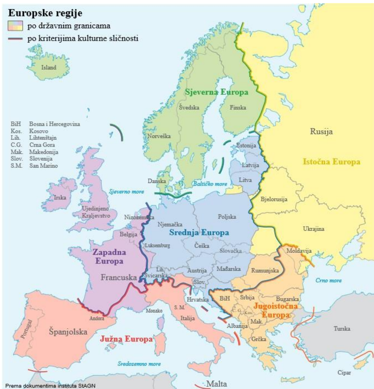
(Slika 2.) Europske regije

„Pojam Balkan obojen je negativnim značenjima: nasilje, vjerska i etnička nesnošljivost, sveopća nazadnost i podjeljenost. U engleskom jeziku riječ balkanisation ( balkanizacija ) označava neizlječivu rascjepkanost i netrpeljivost između frakcija unutar neke grupe. Zato se ta riječ na rubnim područjima izbjegava i ponekad smatra pogrdnom. U nekim zemljama bivše Jugoslavije koristi se i pojam balkanska krčma, koji se proslavio zbog Krežine rečenice: "Kad se u balkanskoj krčmi pogase svjetla, onda sijevaju noževi." Postoji i neutralniji izraz za Balkan, a to je Jugoistočna Evropa . „ 8