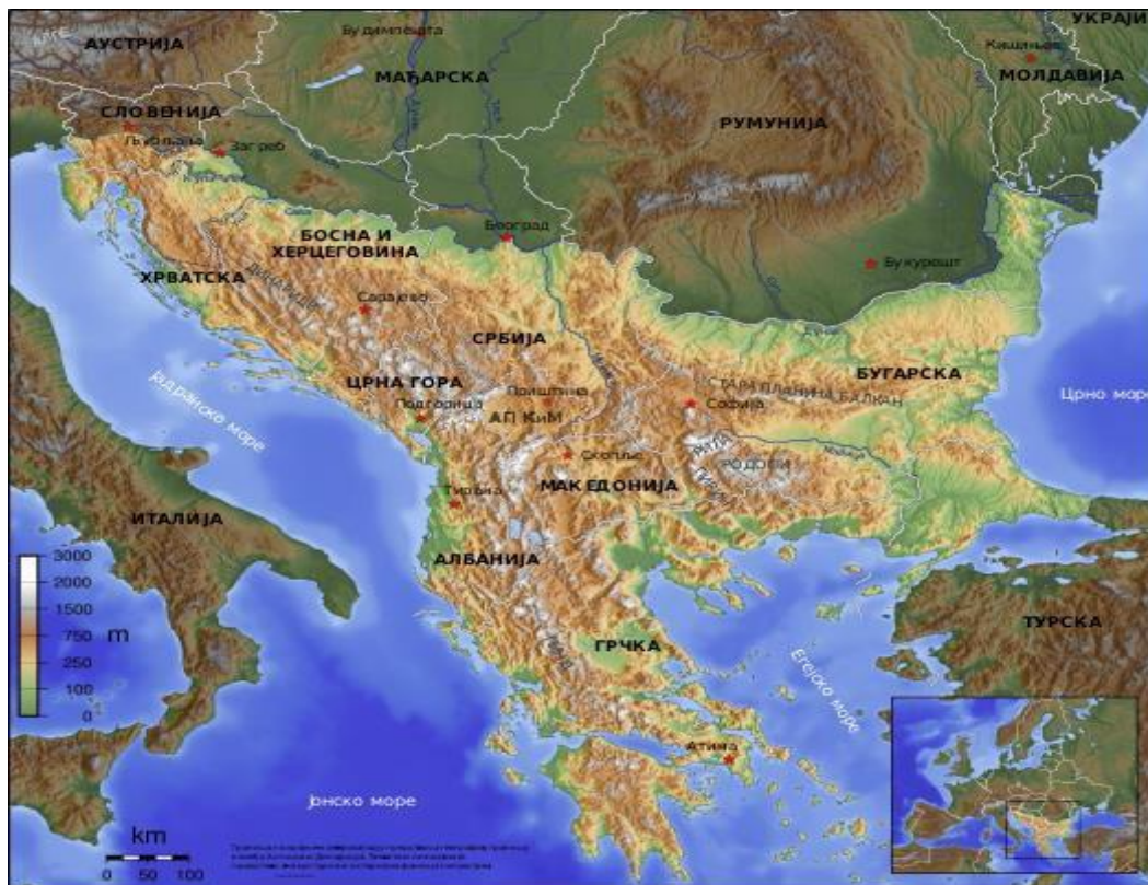
Slika 1. Balkanski poluotok (osvjetljeni dio)

Disolucijom SFR Jugoslavije u Jugoistočnoj Europi također je nastao vakuum koji je omogućio zapadnim silama da svojim vojno-političkim djelovanjem ostvare dominantan utjecaj u regiji koji traje do danas.