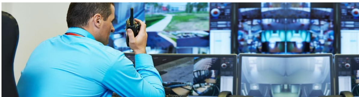
Slika 3 Ilustracija privatne sigurnosti (fizička i tehnička zaštita)

Kao što je prikazano u prethodnom dijelu rada, termin sigurnost je svima poznat i kao takav u dovoljnoj mjeri razumljiv, bez obzira na problem precizne naučne odrađenosti i definisanja. Još uvijek u cijelosti ne postoji, na naučnoj osnovi elaborirano terminološko određenje pojma privatne sigurnosti. Ne postoji općeprihvaćena definicija privatne sigurnosti, ali ni do kraja definirani djelokrug aktivnosti.