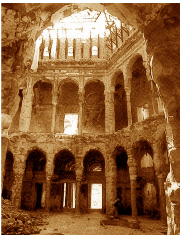
Unutrašnjost Vijećnice – destrukcija

Svestran i plodonosan rad kulturnih i naučnih radnika u navedenim institucijama kulture pretvorio se u borbu za spašavanje muzejskih i bibliotekarskih fondova stvaranih dugogodišnjim radom i zalaganjem. Početkom agresije na Bosnu i Hercegovinu i ratnih dejstava koja su trajala do kraja 1995. navedene institucije kulture bile su izložene neviđenoj destrukciji. Prvo je stradala zgrada Vijećnice u kojoj je bila smještena Nacionalna i univerzitetska biblioteka BiH. Granatirana je i zapaljena sa položaja vojske Republike Srpske 25/26. avgusta 1992. godine.