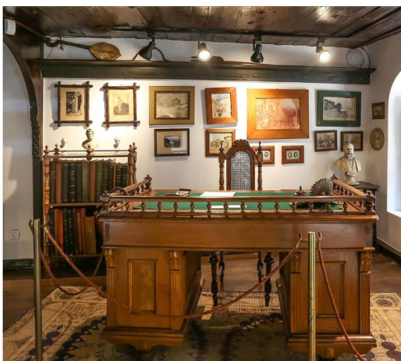
Soba Silvija Strahimira Kranjčevića

Sedamdesetih godina prošlog stoljeća Muzej književnosti BiH proširuje svoju djelatnost kao Muzej književnosti i pozorišne umjetnosti BiH i počinje izučavati i prezentovati pozorišnu umjetnost. Danas muzej baštini 87 književnih i 17 pozorišnih zbirki sa preko 22.000 eksponata (knjiga, časopisa, pozorišnih plakata, programa, fotografija, ličnih dokumenata, predmeta...).