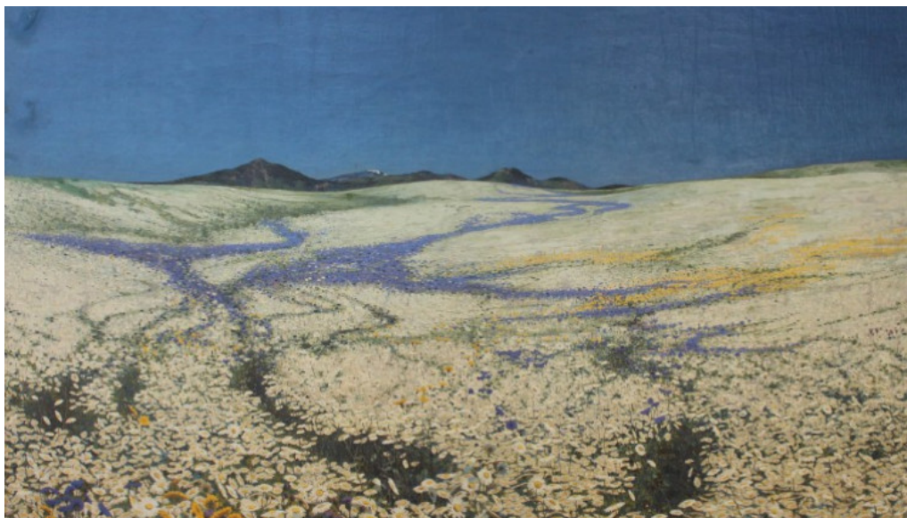
„Cvjetna visoravan” – Gabriel Jurkić

jugoslovenske umjetnosti, međunarodna zbirka donacija, kolekcija fotografija i likovni arhiv Nada dio je bogatog fundusa Umjetničke galerije BiH.