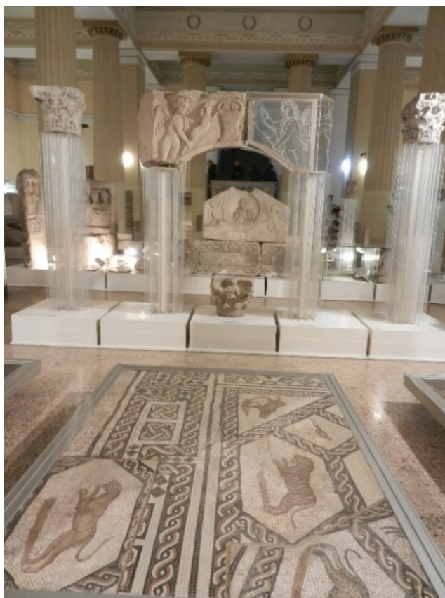
Stalna postavka odjeljenja za arheologiju Zemaljskog muzeja BiH

Djelujući u različitim političkim i ekonomskim prilikama muzej i dalje čuva i prezentira javnosti, pored ostalog, i remek-djelo španske iluminatorske umjetnosti poznatije kao „Sarajevska Hagada” 27 , nalaze i predmete sa dvora kraljevske dinastije Kotromanić, a bosanski stećci i dalje krase prostor kompleksa Zemaljskog muzeja BiH.