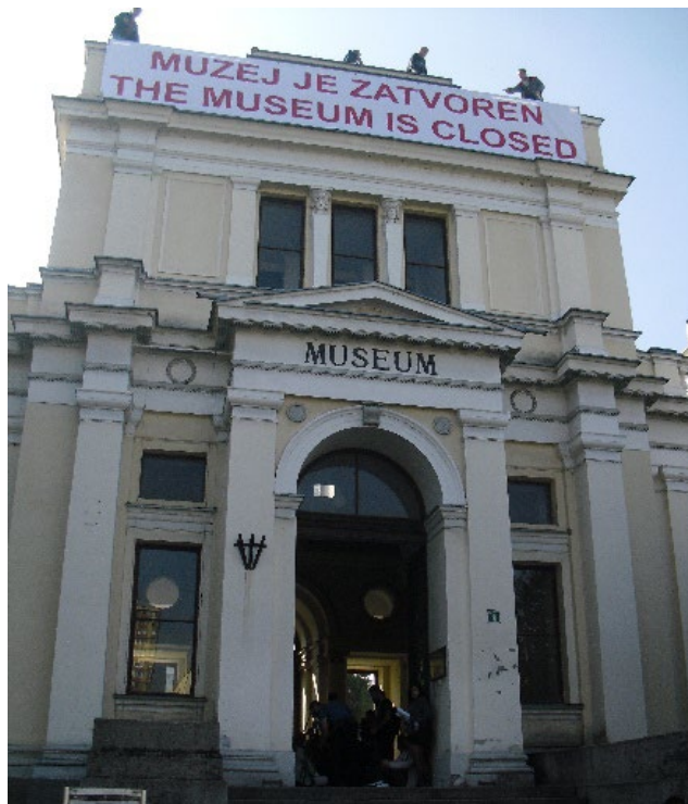
„Muzej je zatvoren“, oktobar 2012.

Shodno tome, nije im uplaćeno ni zdravstveno ni penziono osiguranje. Zbog teškog materijalnog stanja i na granici vlastitog opstanka Zemaljski muzej BiH poslije 124 godine svog postojanja 4. oktobra 2012. prestaje sa radom.