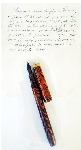
Nalivpero Ive Andrića

Ideja o formiranju Muzeja književnosti BiH začeta je davne 1955. godine. Slučajnost je htjela da Muzej bude osnovan 1961. godine, iste godine kada je Ivo Andrić dobio Nobelovu nagradu za književno djelo Na Drini ćuprija . U želji da se iskaže poštovanje prema književnoj umjetnosti i određenim ličnostima koji su djelovali u određeno vrijeme i u određenom prostoru, Muzej književnosti BiH prikupio je, osim književnih djela i različite vrste ličnih predmeta kao trajnu uspomenu na njih. Jedan od onih koji je podržao osnivanje Muzeja književnosti BiH i smatrao da u njemu treba da budu pohranjeni njegovi originalni radovi bio je Ivo Andrić. Zbog njegove izričite želje u muzeju se nalazi originalna verzija rukopisa romana Na Drini ćuprija i nalivpero s kojim je pisao svoja djela. U posveti je napisao: „Ovo pero sam kupio u Ženevi u jesen 1936. godine. Služio sam se njime do početka 1945. godine. Sve što sam u tih osam i po godina napisao, pisano je bilo ovim perom. U proljeće 1945. godine ono je već bilo toliko istrošeno i dotrajalo da sam morao nabaviti novo.”