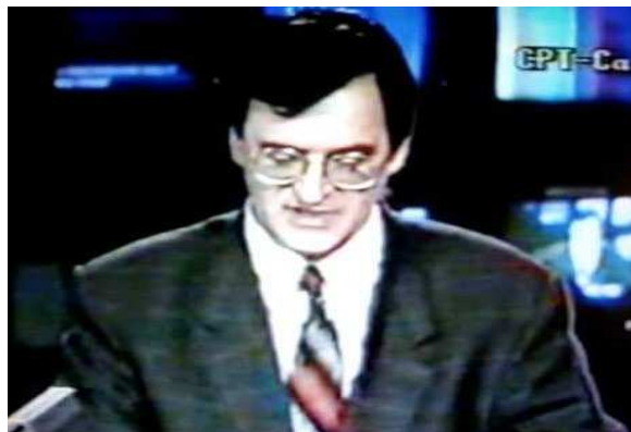
Slika 5. Dnevnik, Dragan Božanić 41 poziva civile na klanje 1993 godine 42

Međutim, kako su izjavili bivši logoraši, prilikom posjete Božanića, kao i drugi novinari Srne, bili su prinuđeni da pred TV kamerama pročitaju prethodno pripremljen tekst u kojem je stajalo da se prema zatočenicima postupa sasvim humano i korektno. Inače, Božanićev otac Bogdan je bio pukovnik bivše JNA.