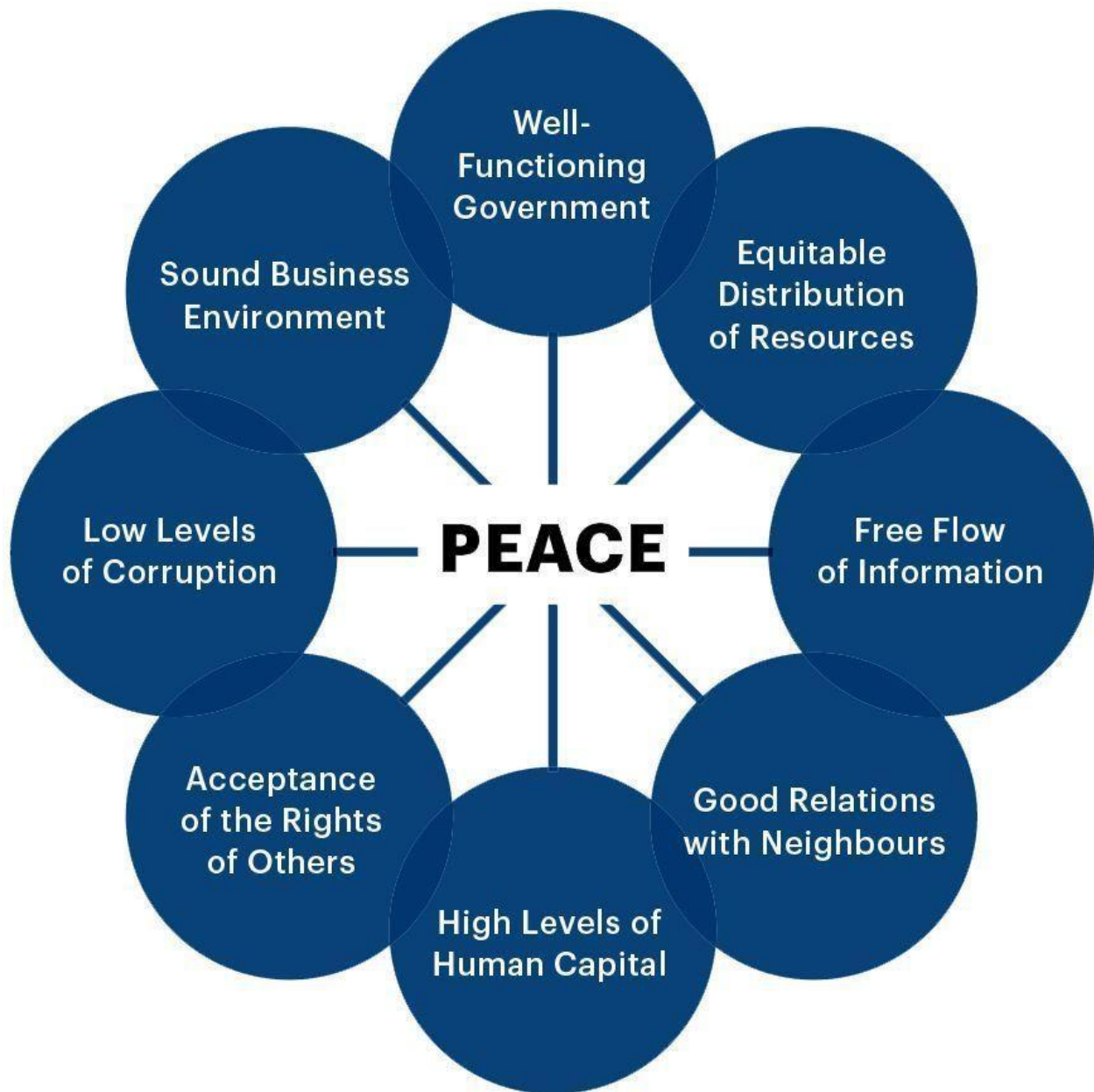
Slika br.1: The pillars of positive peace 125

uzroci negativnog mira u Bosni i Hercegovini ? Da li ih možemo potražiti u konstrukciji Dejtonskog mirovnog sporazuma ? U kojoj mjeri preovladava negativni mir u Bosni i Hercegovini ? Nakon pronalaska na ova i još mnoga druga pitanja, eventualno ponuditi moguća rješenja, koja bi značila transformaciju negativnog mira u pozitivan mir u Bosni i Hercegovini.