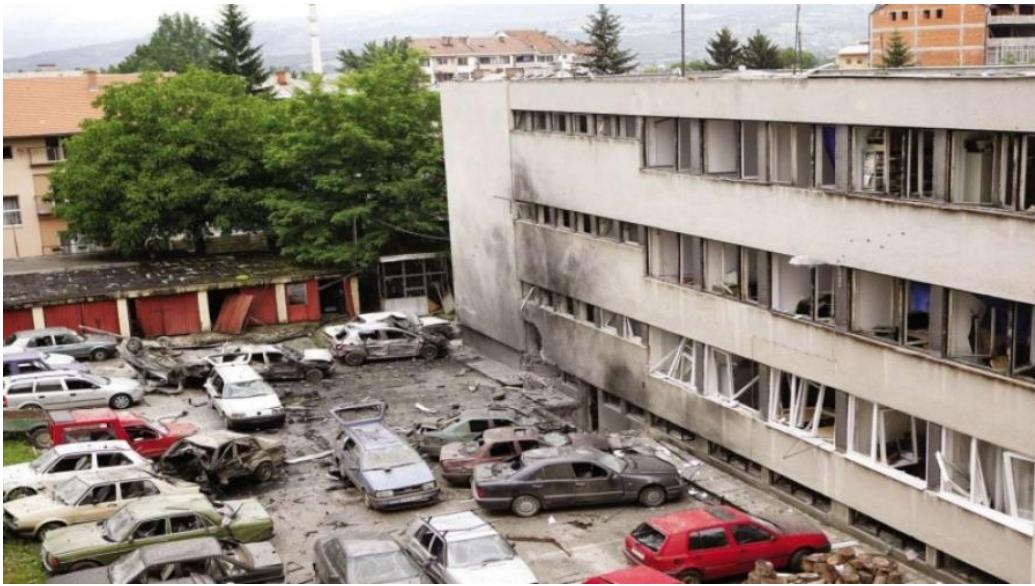
Slika.4 – Policijska stanica u Bugojnu nakon terorističkog akta

zatim u slučaju izvršenja napada sa elementima terorizma, (napad auto-bombom na policijsku stanicu u Bugojnu 2010. godine)