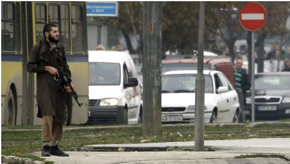
Slika.5 – Napadač u trenucima dejstva na Ambasadu Sjedinjenih Američkih Država u Sarajevu

ili djela koje je okarakterisano kao izolovani teroristički napad (otvaranje vatre iz automatskog naoružanja na ambasadu SAD-a u Sarajevu 2011. godine),