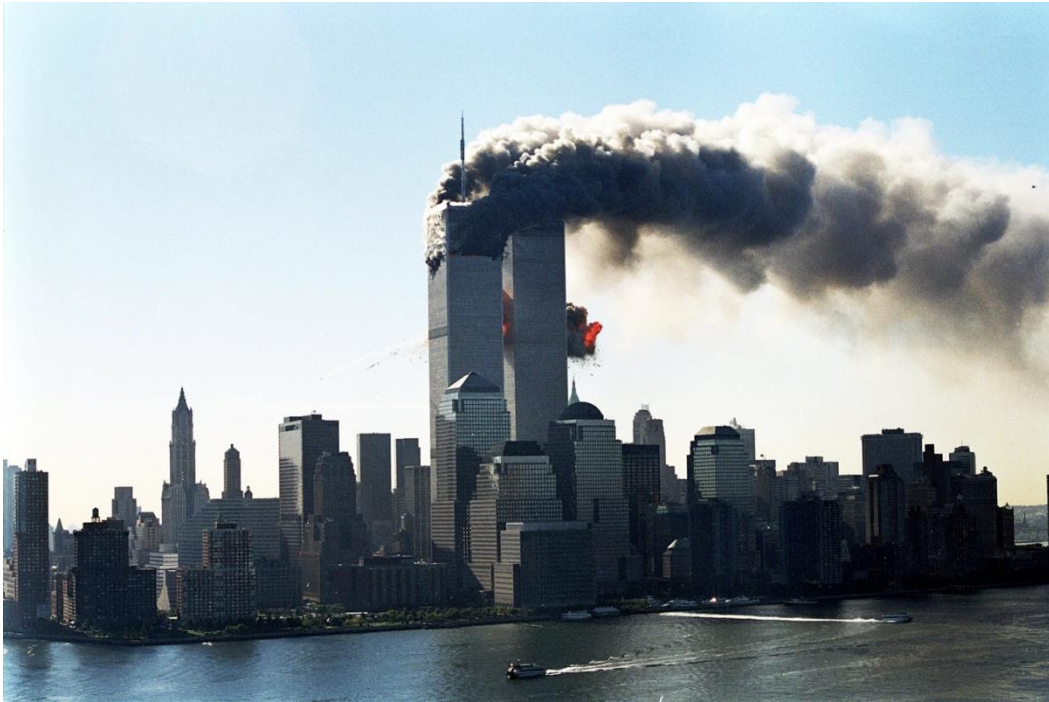
Slika.1- Pripadnici Al-Qaide su septembra 2001. godine oteli četiri američka putnička aviona i izveli koordinirani napad na više ciljeva u Sjedinjenim Američkim Državama