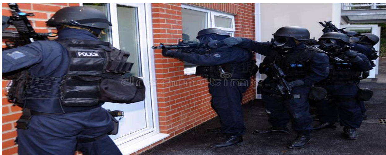
Slika 3. SWAT tim britanske specijalne policije

Unutar Britanskog Nacionalnog kriminalističkog odreda, obavještajne jedinice su spojene sa Operativnim oblastima i Operativnim granama, pri čemu svaka obavještajna jedinica ima svoju analitičku jedinicu i jedinicu finansijske policije, odnosno jedinicu za privredni kriminal koji se smatra pratećom pojavom većine tipova organizovanog kriminala. Hijerarhija analitičke službe odgovara organizacionom nivou na kome djeluje konkretna jedinica. Na nižim nivoima, koji uglavnom uključuju "terenski rad", analitika je vrlo konkretna i bavi se obavještajnim materijalom koji odgovara konkretnim zadacima jedinice i tekućim policijskim istragama. Odred je primarno zadužen za preventivne aktivnosti, a ne za represivne. Svi operativni i obavještajni timovi imaju svoje analitičare, a preventivne istrage se odvijaju kako na nacionalnom, tako i na međunarodnom nivou, kroz bilateralnu saradnju sa policijama pojedinačnih zemalja, učesće u aktivnostima Europolu i Interpolu i druge oblike multilateralne policijske saradnje. Preventivni pristup odreda znači da su obavještajna i analitička aktivnost usmjerene prije svega prema predviđanju budućih kriminalnih aktivnosti i pokušajima da se one spriječe, radije nego na reagovanju na aktuelna krivična djela i obavljanju standardnog policijskog posla, koji je uglavnom zadatak lokalnih policijskih snaga. 31