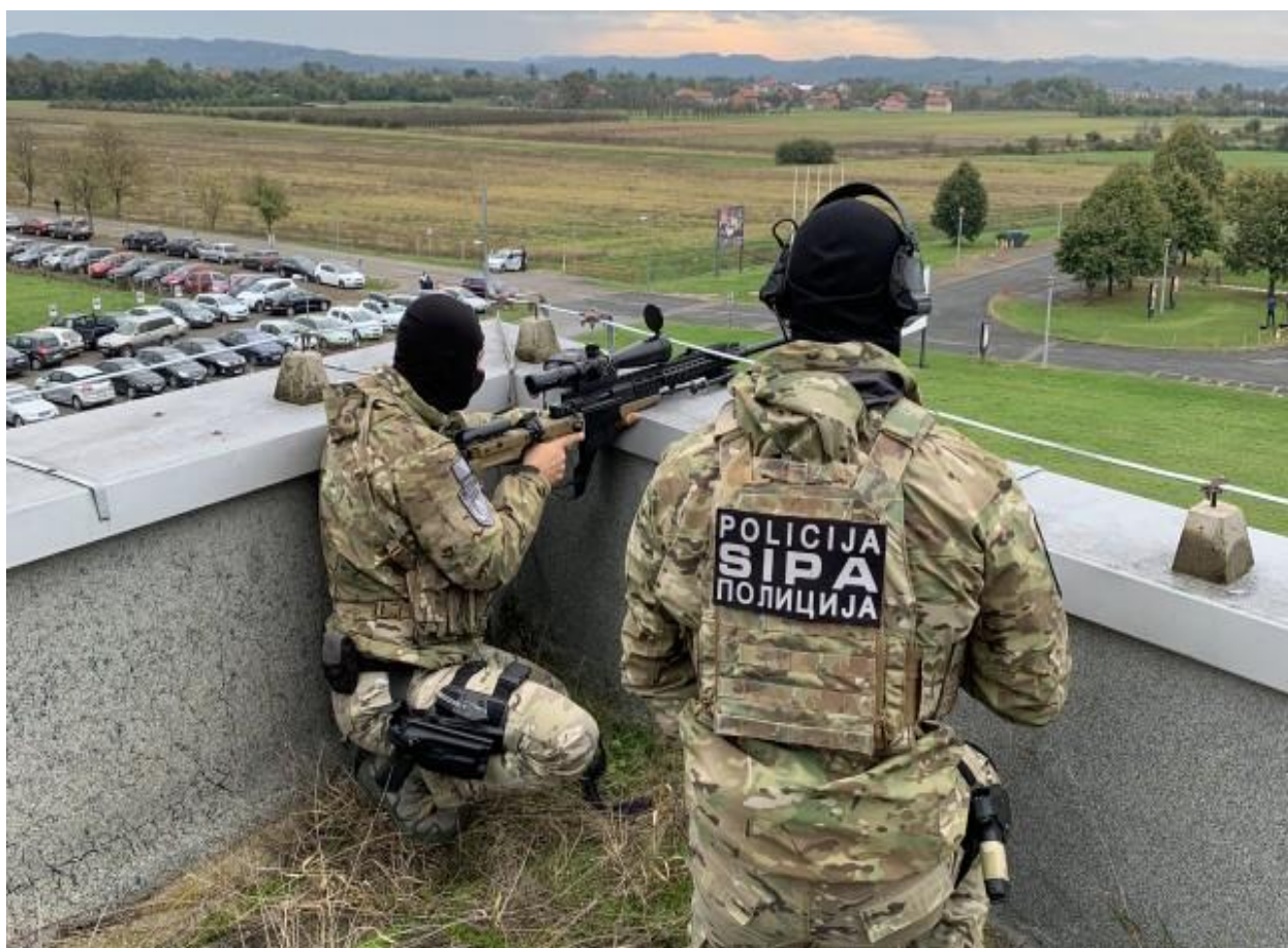
Slika 1. Jedinica za specijalnu podršku SIPA-e

specijalistička znanja i vještine alpinizma, vertikalnog upada savladavanje teško prohodnih i nepristupačnih terena, antisnajperske zaštite, spašavanje i vještine na vodi i pod vodom, te pružanje podrške ostatku jedinice u njihovim misijama. Obavlja i druge poslove u skladu sa zakonom. Odsjek za podršku „GAMA“ pruža podršku ostatku jedinice u izvršavanju zadataka iz nadležnosti jedinice, osiguravajući brze i efikasne manevarske taktičke operacije u svim vremenskim uslovima i specifičnim situacijama, a zatim pruža specijalističku podršku kada je neophodno angažovanje službenih pasa. Obavlja poslove fizičke zaštite objekata, veze, kriptozastite i druge poslove u skladu sa zakonom. 16