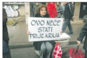
Građanka s plakatom jučer ispred Higijenskog zavoda