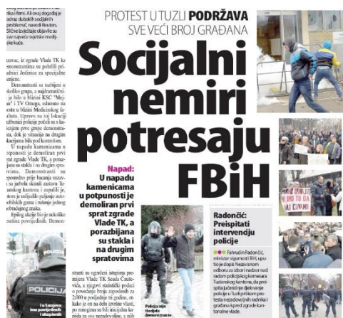
Slika 6. RS protesti ne dotiču (Nezavisne novine, 2014)

Slične tekstove daju i na portalu i u novinama, na portalu samo nešto kraće. U prvom tekstu o protestima štampanom u Nezavisnim 7. februara pod naslovom „Socijalni nemiri potresaju Federaciju BiH“ pišu da je dan prije bio najdramatičniji u Tuzli, te da i najveći svjetski mediji prenose vijesti iz Federacije BiH (Reuters : “Ovaj događaj je odraz dubokih socijalnih problema“), što navodi na razmišljanje da se preciznim lociranjem Federacije valjda šalje poruka da Republiku Srpsku protesti ne dotiču. U prvim izvještajima Nezavisnih nema izjava političara osim one ministra sigurnosti BiH Fahrudina Radončića koji poziva da se preispita intervencija policije u Tuzli.