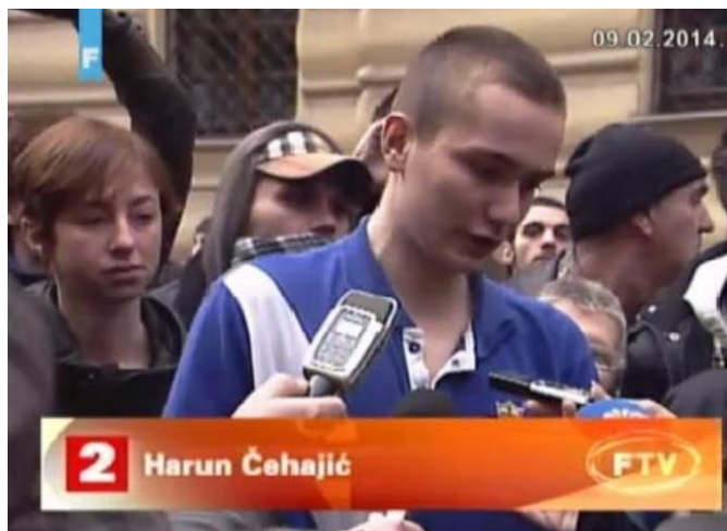
Slika 4. Prilog FTV o oslobađanju uhapšenih demonstranata (Kontić, 2014)

Kritika je data i voditeljici nedjeljnog Dnevnika (9.2.2014.) što nije odgovorila članu Predsjedništva BiH Željku Komšiću koji joj je, kako ističe Kontić „bezmalo zaprijetio da ga ne prekida dok govori.“ Analitičar smatra da je voditeljica „valjda trebala odgovoriti 'To možete na partijskom skupu, ali na javnu televiziju dolazite da odgovarate na pitanja, a ne da držite govore'“ i dodaje „Doduše, treba reći da je voditeljica do kraja dobro kontrolisala zahtjevan program“. Netom nakon protesta iz Federalne TV je rečeno da su dali prostora svima da govore i da je FTV opravdala ulogu javnog servisa. Tome u prilog podatak da je Federalna TV tri sedmice prije kroz istraživački magazin Mreža ponudila javnosti priču naslova Kako je pala industrija tuzlanskog bazena?