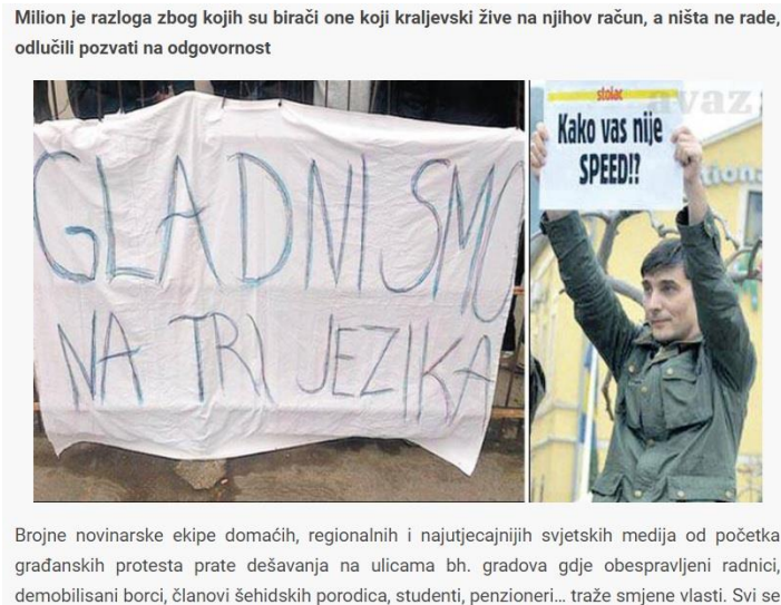
Slika 7. Transparenti sa protesta (Tuzlanski, 2014)

a ne među demonstrantima. No, šteta je već napravljena, portali prenijeli vijest, političari je u istupima koristili. Danima iza ove izjave federalnog premijera, a onda i Bakira Izetbegovića koji je ustvrdio isto o drogi među demonstrantima, u javnosti su se pojavljivali transparenti s tekstem „Kako vas nije speed!“