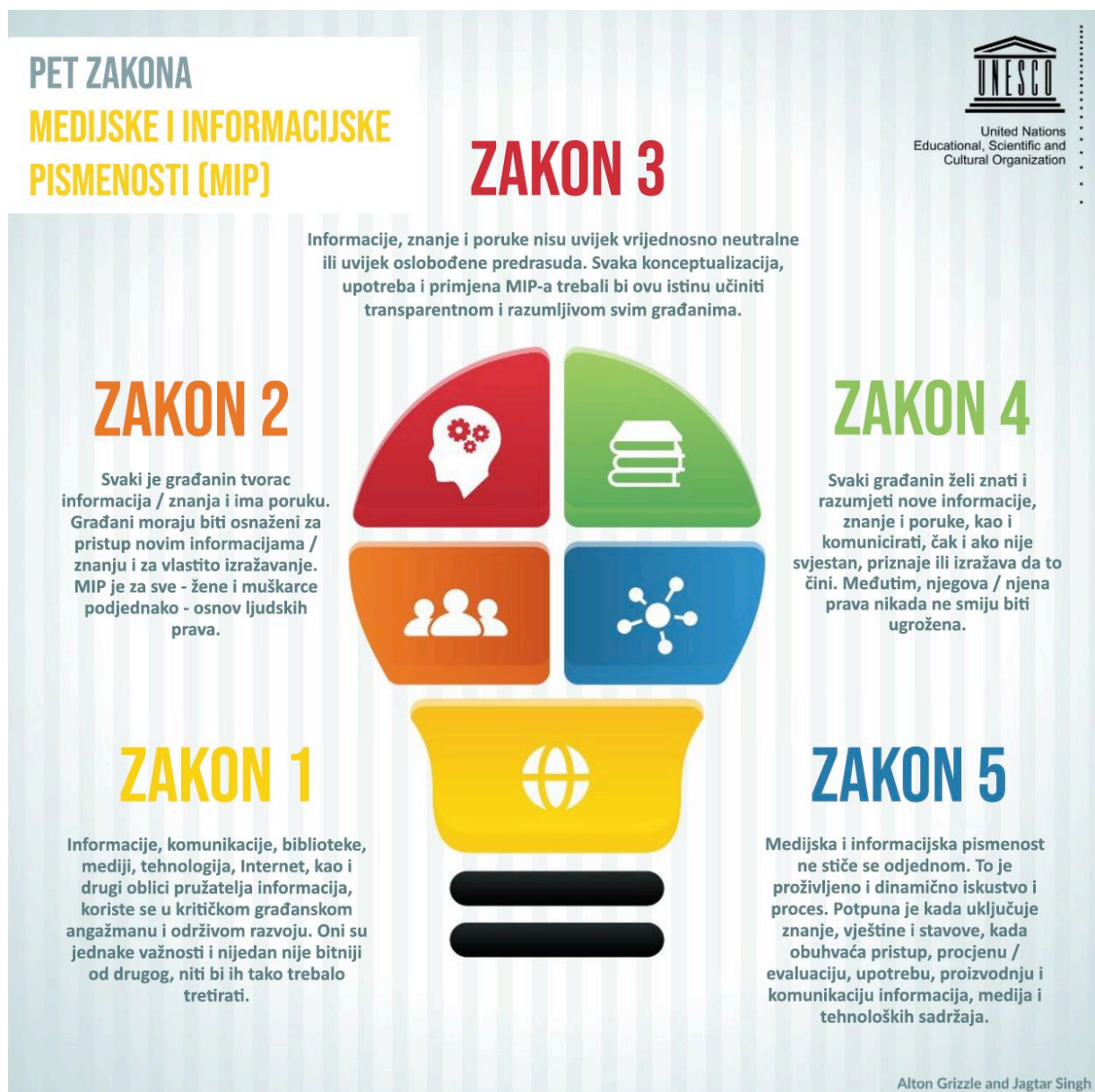
Slika 4. Pet zakona MIP-a (UNESCO, 2017).

U oblasti ljudskih prava treba sagledavati tri segmenta pristupa MIP-u: