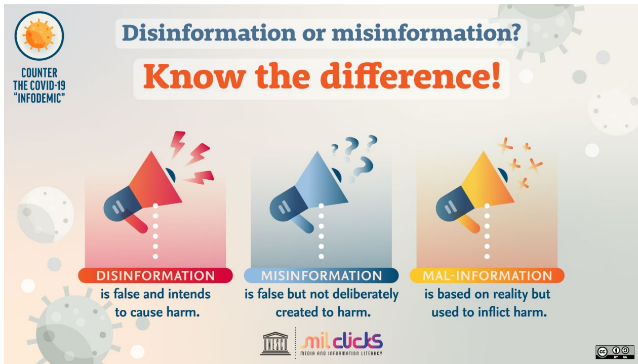
Slika 6. Razlike među vrstama дезинформације (UNESCO, 2020)

Oснаживање популације која може идентифицирати и избјећи дезинформације није само најučинковитије рјешенје него и најдемократскији начин за враћање повјерења у sugрађане, медије и друге институције. Развој критичког мишљења посебно оснажује грађане да доносе информиране одлуке о томе које су информације вриједне њихова повјерења умјесто да те одлуке препуштају владајућим субјектима, што може бити супротно демократским идеалима. (Jolls i Johnsen, 2018: 1402)