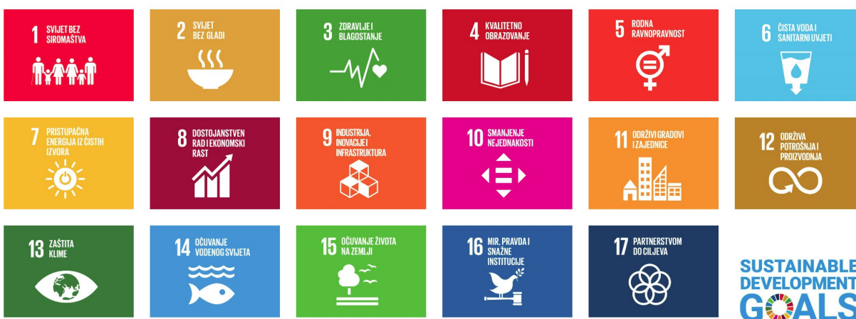
Slika 3. Ciljevi održivog razvoja Agende 2030. (Institut za društveno odgovorno poslovanje, 2021)