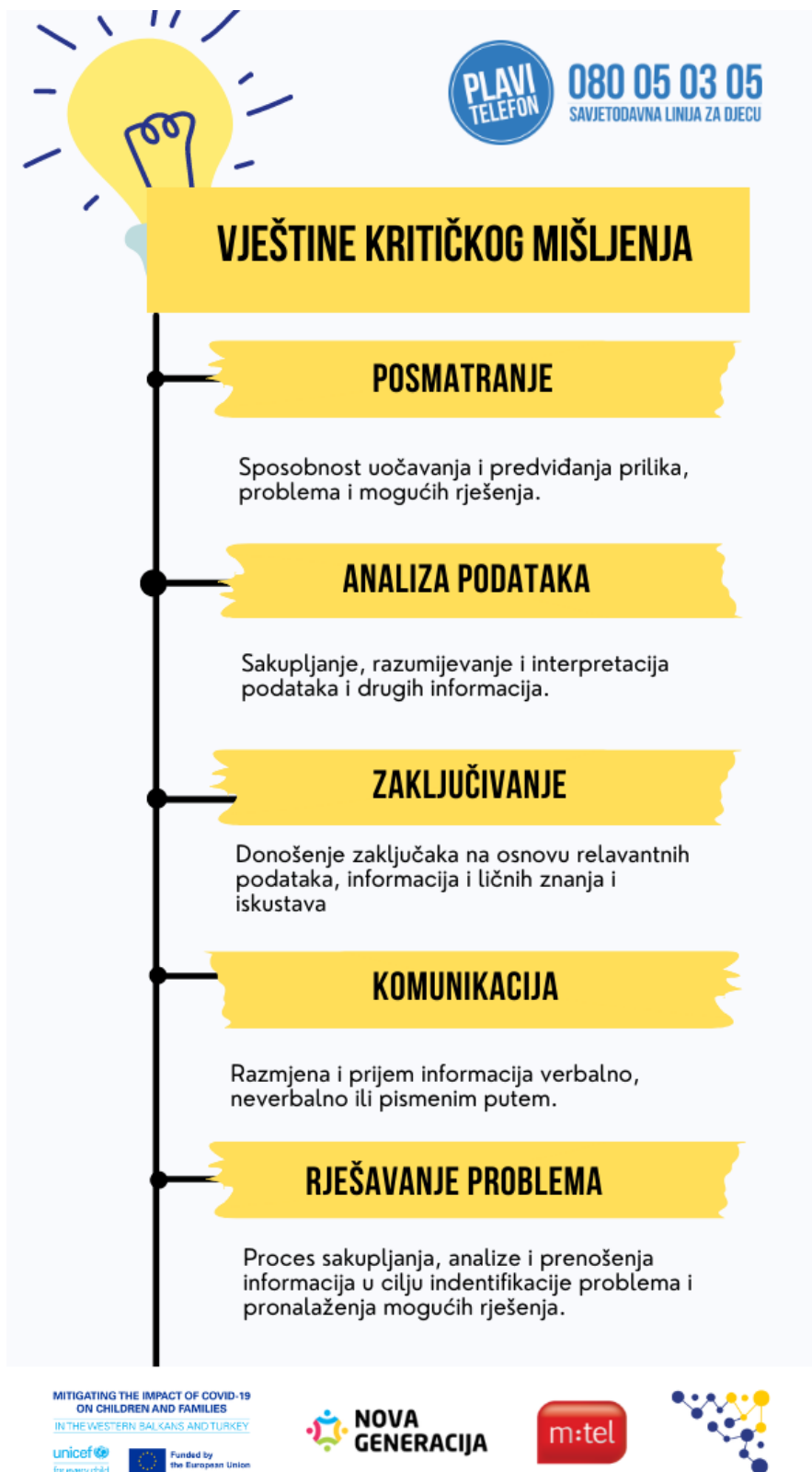
Slika 5. Vještine kritičkog mišljenja (Regulatorna agencija za komunikacije, 2021)