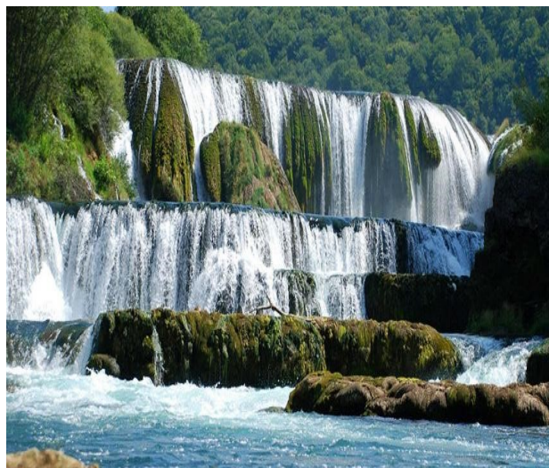
Slika 2. Rijeka Una

Iako priroda u Bosni i Hercegovini obiluje ljepotom, postoje i izazovi u vezi s zagađenjem zraka, voda i tla. Ovo uključuje pitanja vezana uz industrijske emisije, nepravilno odlaganje otpada i sl.