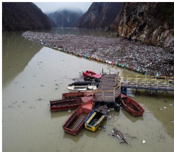
Slika 3. Rijeka Drina (jedan dio)