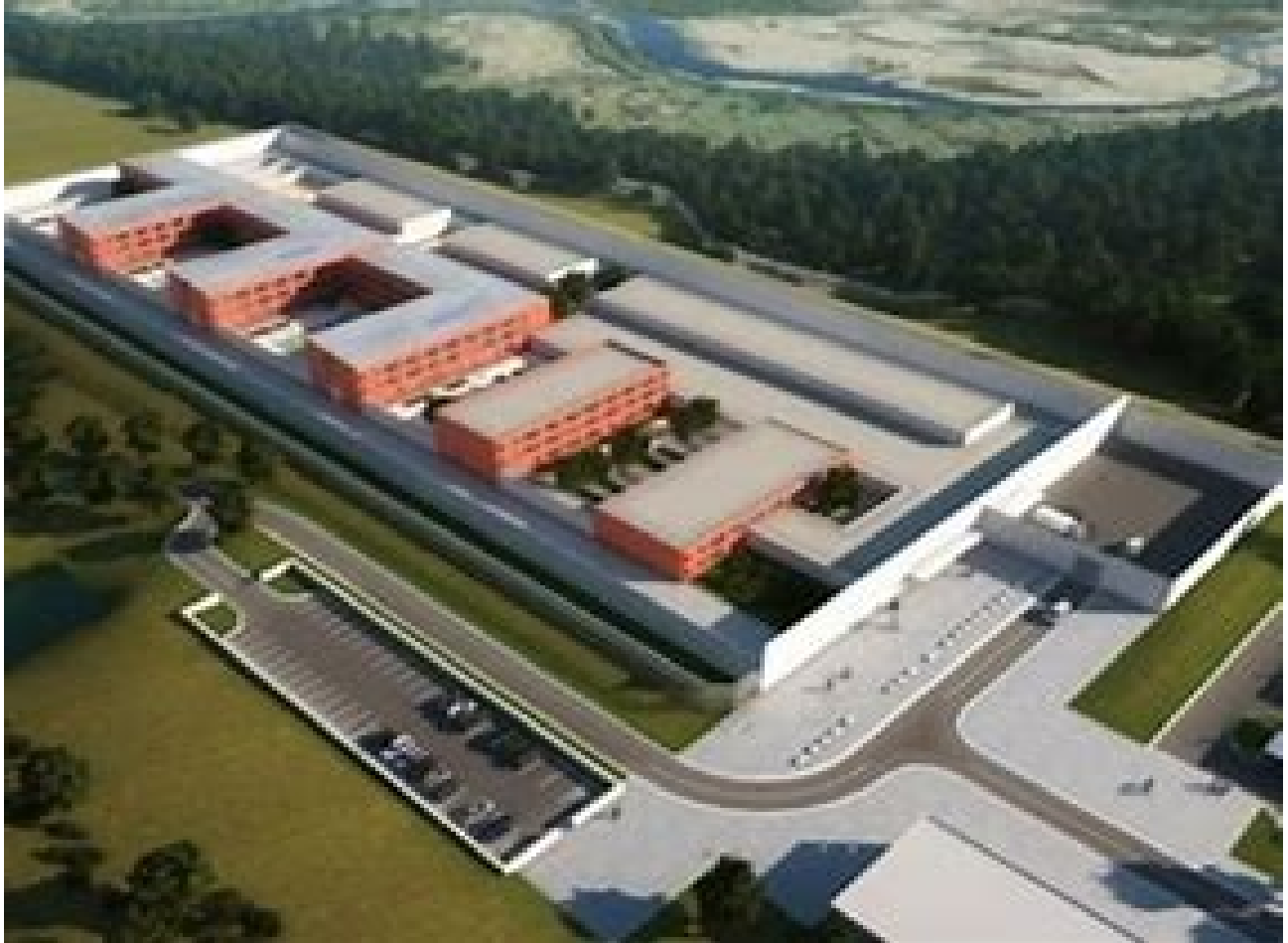
Zavod za izvršenje krivičnih sankcija, pritvora i drugih mjera Bosne i Hercegovine