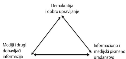
Figura 2: Važnost MIP-a

U optimalnom modelu pozitivni ishodi učenja se osiguravaju tako što strateške smjernice nalažu medijsku i informacijsku pismenost kako učenika tako i nastavnika. Okosnica strateškog promišljanja je u osposobljavanju nastavnika i bibliotekara za izgradnju